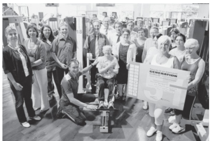
Bessere Arbeits-Chancen durch Sport: Mit dem Projekt Generation Gold sollen Langzeit-Arbeitslose gestärkt werden.

Da Gesundheit auch etwas mit Ernährung zu tun hat, hängen die Anbieter auch gleich noch das Seminar „Preiswert, gesund und lecker“ mit dran. Hier erhält die Gruppe theoretische und Tipps für die Zubereitung gesunder, schmackhafter Mahlzeiten auch bei kleinen Budgets. Das exklusive Projekt ist befristet auf ein halbes Jahr. Alle anderen können bei offenen Kursen der Krankenkassen einsteigen.